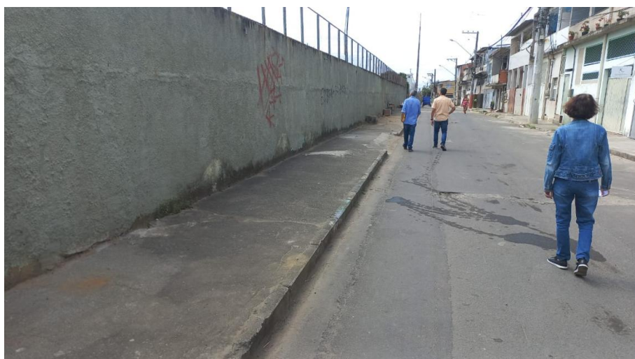
Foto 05 – Vista externa do muro pela face sul (Rua Boa Vista) e situação da calçada.

Notabilizou-se na parte interna do muro da face Sul, um talude que se encontra abarrotado de tocos de árvores que foram suprimidas, tornando o terreno aparentemente não propício ao plantio de outro tipo de cobertura vegetal, grama por exemplo.