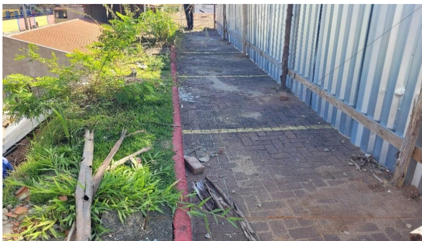
Foto 03 – Vista interna do muro lateral – face oeste, do nível do estacionamento da unidade escolar.